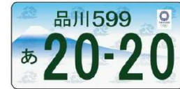
来年 10 月より交付開始 (現在デザイン公募を実施中)

TOKYO 2020 OFFICIAL LICENSED PRODUCT © Tokyo 2020